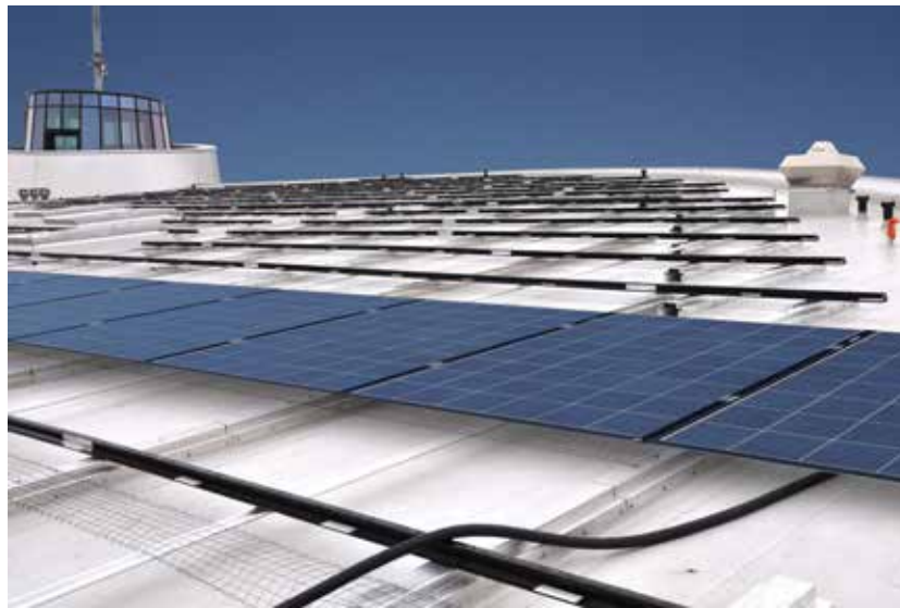
Die KÖSTER BAUCHEMIE AG ist ein weltweit führender Produzent von TPO- und ECB-Dachbahnen mit über 25 Jahren Erfahrung.

KÖSTER TPO-Dachbahnen sind UV-stabil, alterungsbeständig, resistent gegen Mikroorganismen und können direkt auf Bitumendächern oder auf Dämmstoffen verlegt werden (KÖSTER TPO-Bahnen sind dämmstoffneutral).