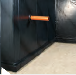
Die Abdichtung ist installiert.