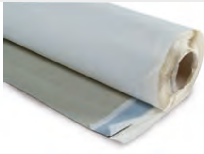
KÖSTER KSK ALU Strong