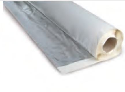
KÖSTER KSK ALU 15